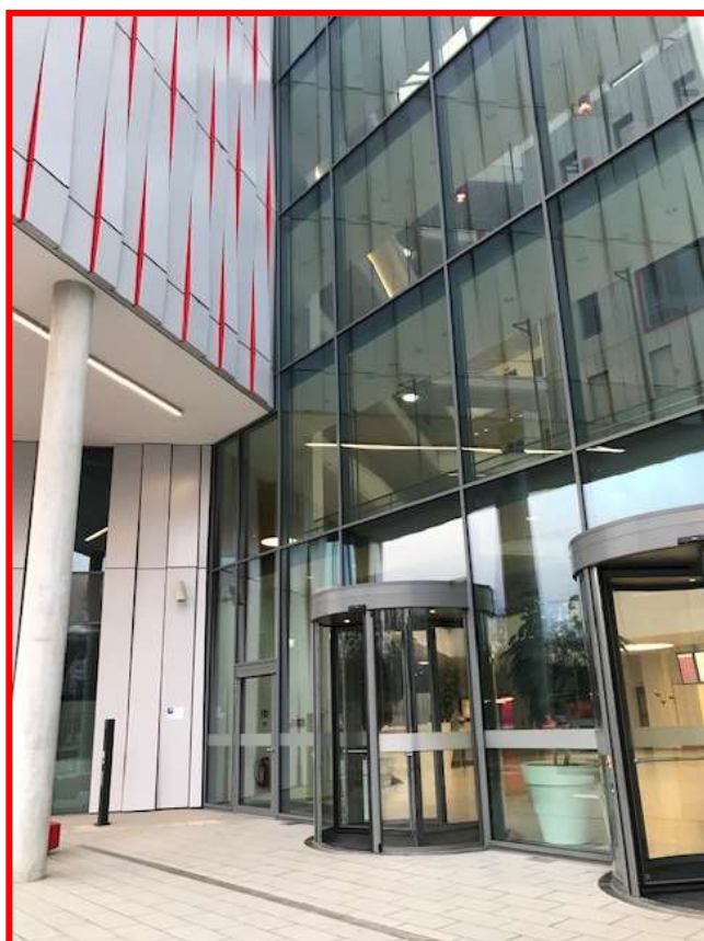
Haupteingang Bessie-Coleman-Straße 7 (HOLM)